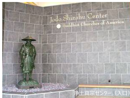
浄土真宗センター(入口)