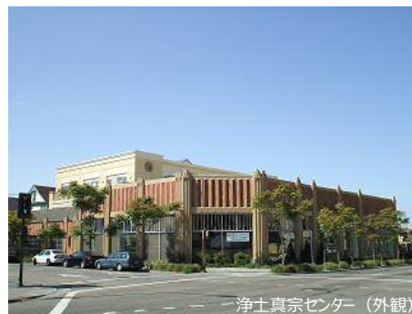
浄土真宗センター(外観)